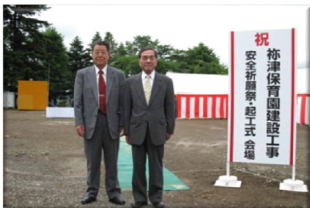
祢津保育園起工式

海野宿の古民家を活用して展示したものです。海野宿の雰囲気郷土玩具の時代性とよくマッチしています。昔懐かしい玩具がいっぱいです。ぜひ来館していただければと思います。